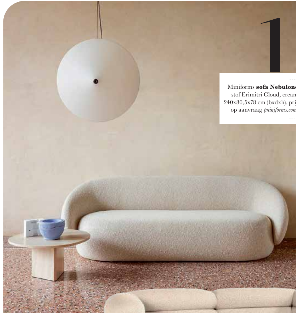
1 ----- Miniforms sofa Nebulone , stof Erimetri Cloud, cream, 240x80,5x78 cm (bx dxh), prijs op aanvraag ( miniforms.com ). -----