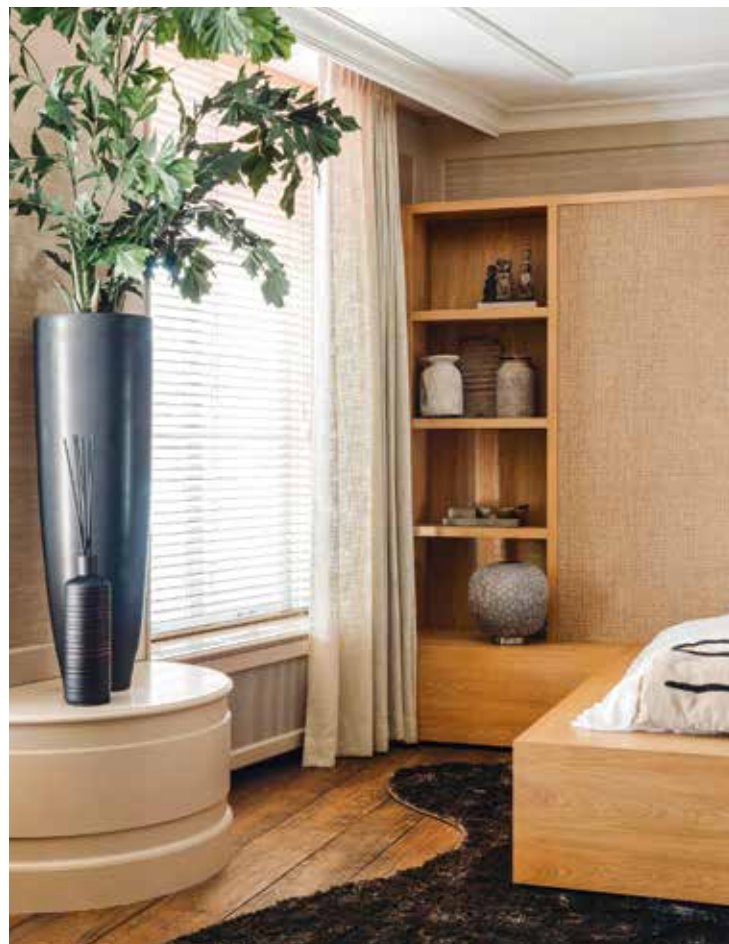
----- LINKS Met een hoge plant op een sokkel werd een groot gebaar gemaakt. -----