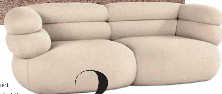
2 ----- Knoll sofa Biboni , ontworpen door Johnston Marklee, stof Solid Sublime, cream, 220x104x76 cm (bx dxh), prijs op aanvraag ( knoll.com ). -----

Een organisch gevormde bank is niet alleen dé plek voor een goed gesprek, hij geeft met z'n rondingen de ruimte een flinke dosis zachtheid.