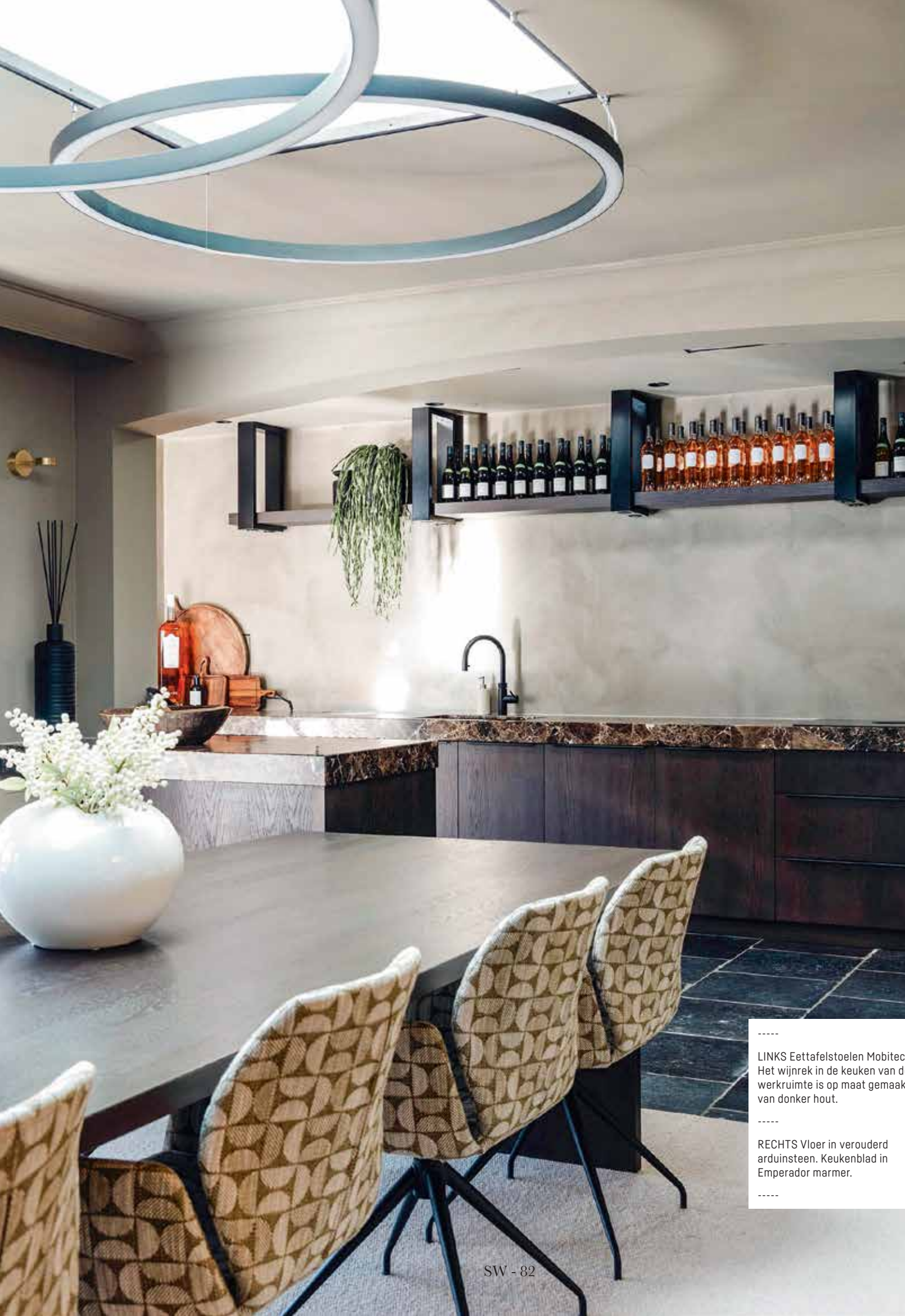
----- LINKS Eettafelstoelen Mobitec. Het wijnrek in de keuken van de werkruimte is op maat gemaakt van donker hout. ----- RECHTS Vloer in verouderd arduinsteen. Keukenblad in Emperador marmer. -----