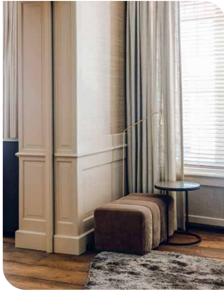
----- Wollen vloerkleed Aventura. Poef op maat gemaakt. Bijzettafel Raw Interiors. -----