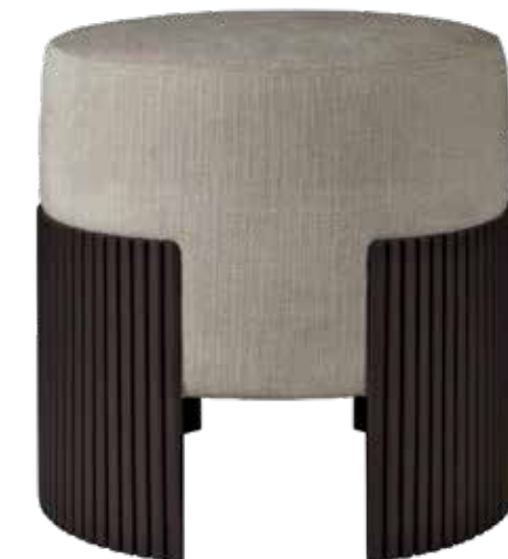
3 ----- Ethnicraft poef Roller Max , ontworpen door Jacques Deneef, polyester, katoen en mahoniehout, donkerbruin, 45x44x46 cm (lxbxh) € 459,- ( ethnicraft.com ). -----

Handig als bijzettafel, voetenbank of bijshuiver voor extra gezelschap. Maar deze, met hun bijzondere vormen, voegen vooral een speels en spannend element toe aan de zithoek.