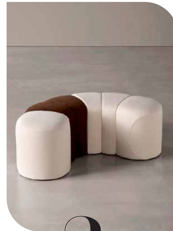
2 ----- Meridiani modulaire poef Baco , ontworpen door Andrea Parisio, hout, stof, magneten en polyurethaan, donkerbruin, diverse afmetingen, prijs op aanvraag ( meridiani.it ). -----