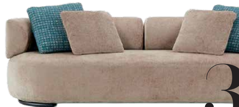
3 ----- Kartell sofa K-Waiting , ontworpen door Rodolfo Dordoni, chenille, beige, 230x81x70 cm (bx dxh) € 5211,- ( kartell.com ). -----