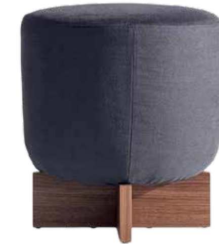
1 ----- Bonaldo poef Cross , ontworpen door Alain Gilles, metaal en stof 8D63, 44x48 cm (Øxh), prijs op aanvraag ( bonaldo.com ). -----