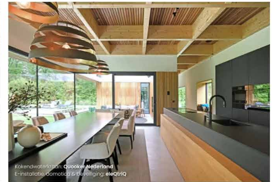
Kokendwaterkraan: Quooker Nederland E-installatie, domotica & beveiliging: eleQtrIQ