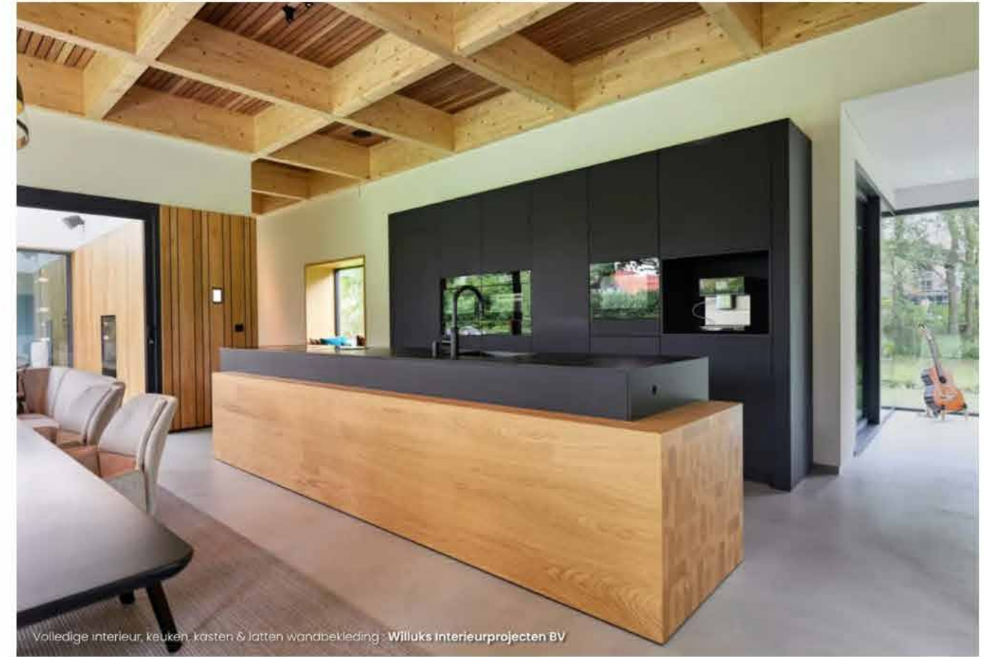
Volledige interieur, keuken, kasten & latten wandbekleding - Willuks Interieurprojecten BV