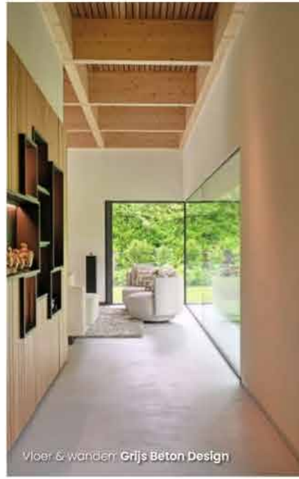
Vloer & wanden: Grijs Beton Design