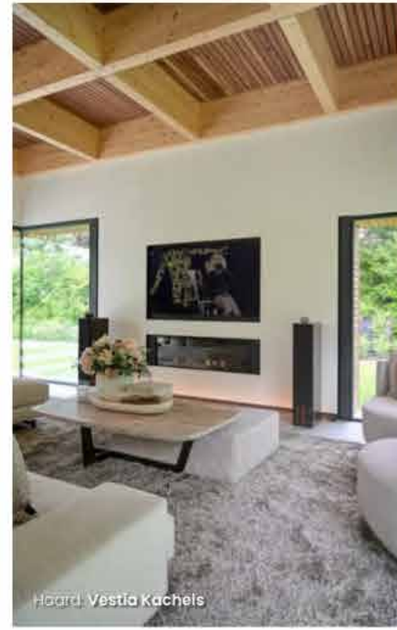
Haard: Vestia Kachels