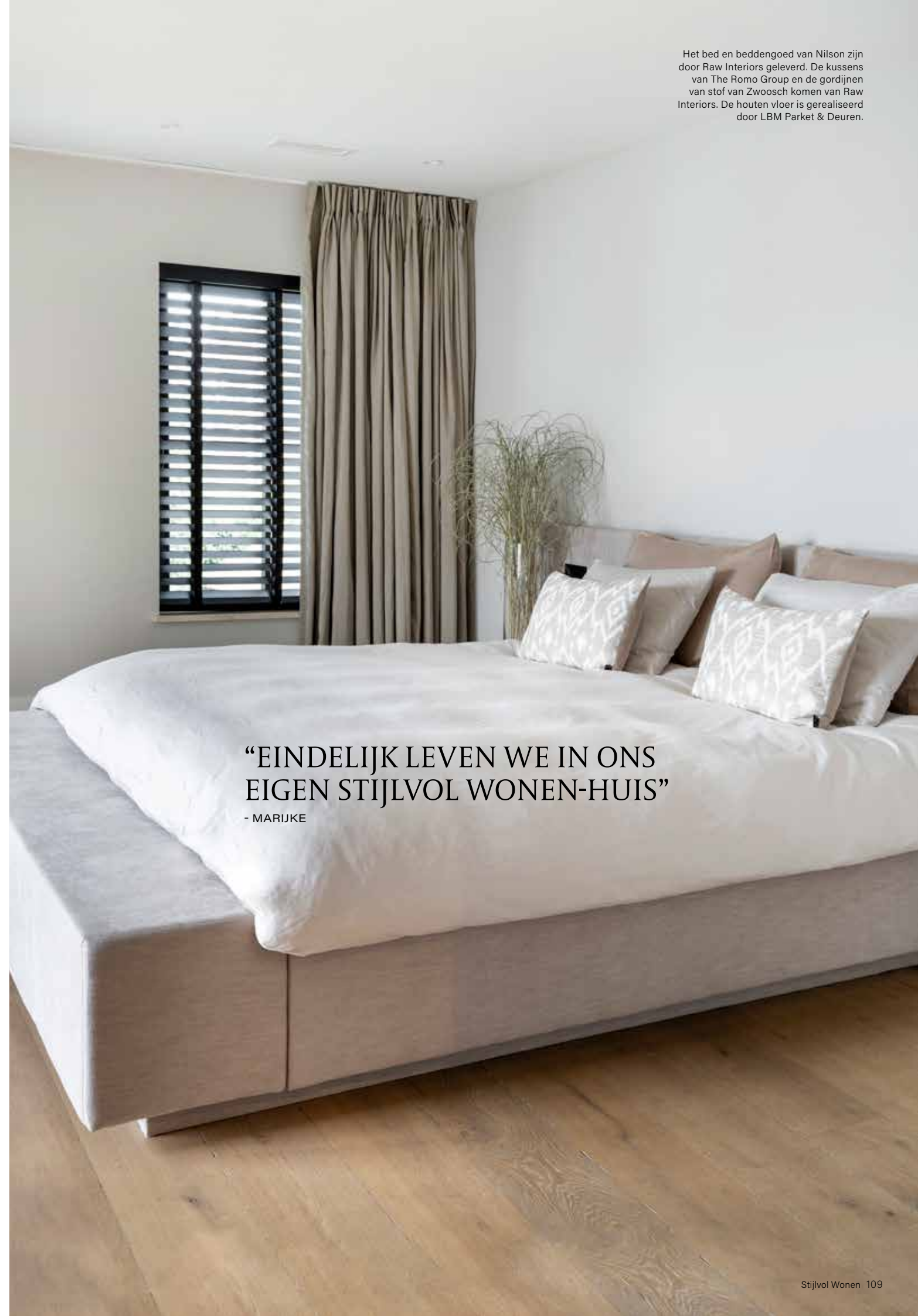
Het bed en beddengoed van Nilson zijn door Raw Interiors geleverd. De kussens van The Romo Group en de gordijnen van stof van Zwoosch komen van Raw Interiors. De houten vloer is gerealiseerd door LBM Parket & Deuren.