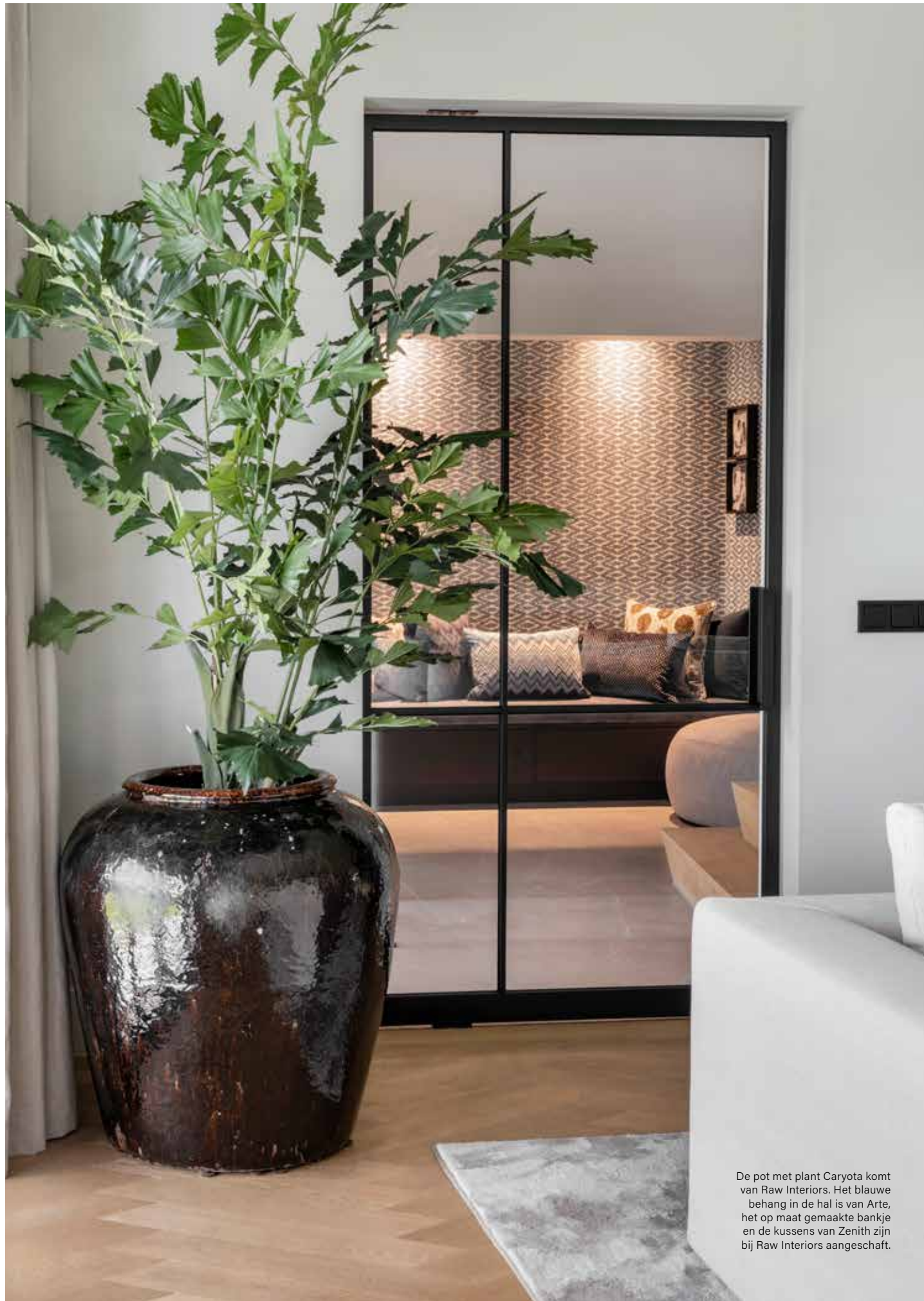
De pot met plant Caryota komt van Raw Interiors. Het blauwe behang in de hal is van Arte, het op maat gemaakte bankje en de kussens van Zenith zijn bij Raw Interiors aangeschaft.