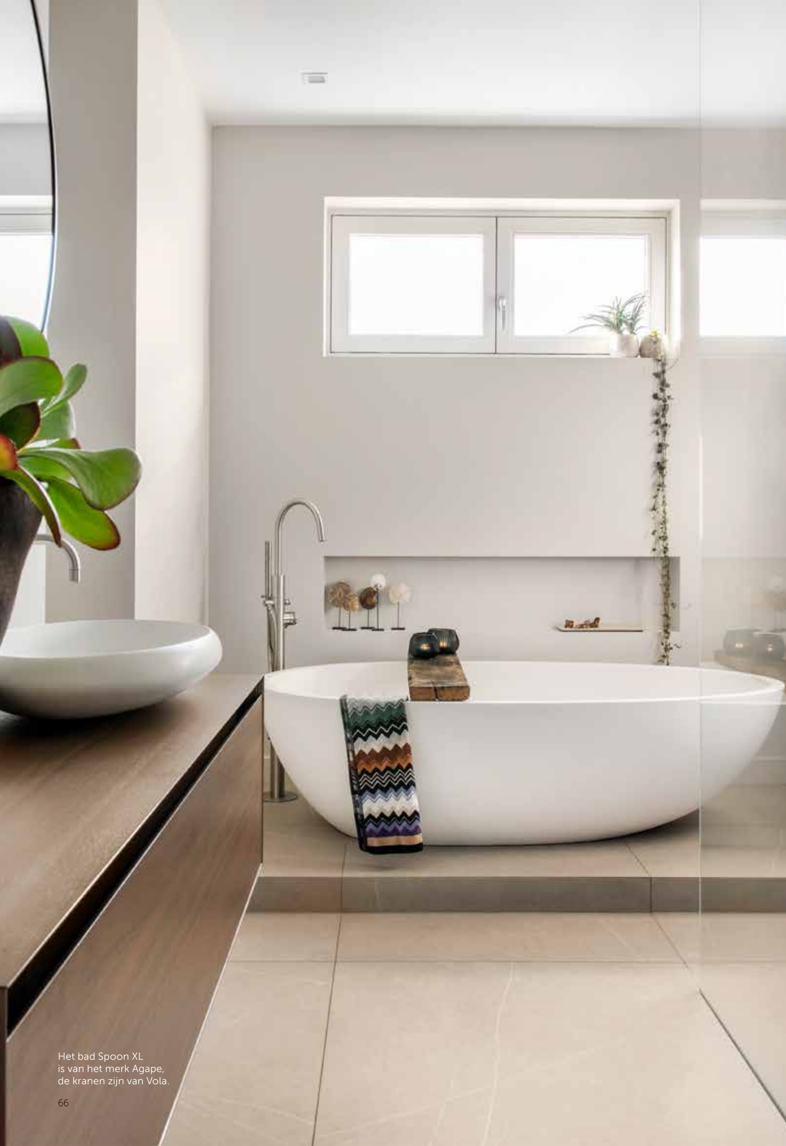
Het bad Spoon XL is van het merk Agape, de kranen zijn van Vola.