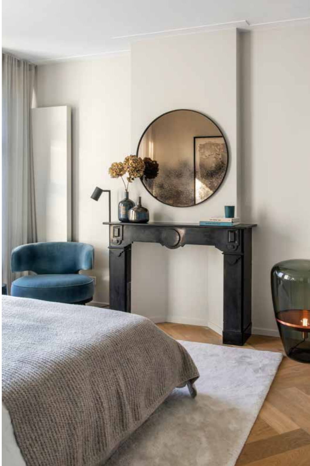
De stoel is van Prades, de spiegel van Ethnicraft en de grote lamp op de vloer naast de schouw is van Brokis.