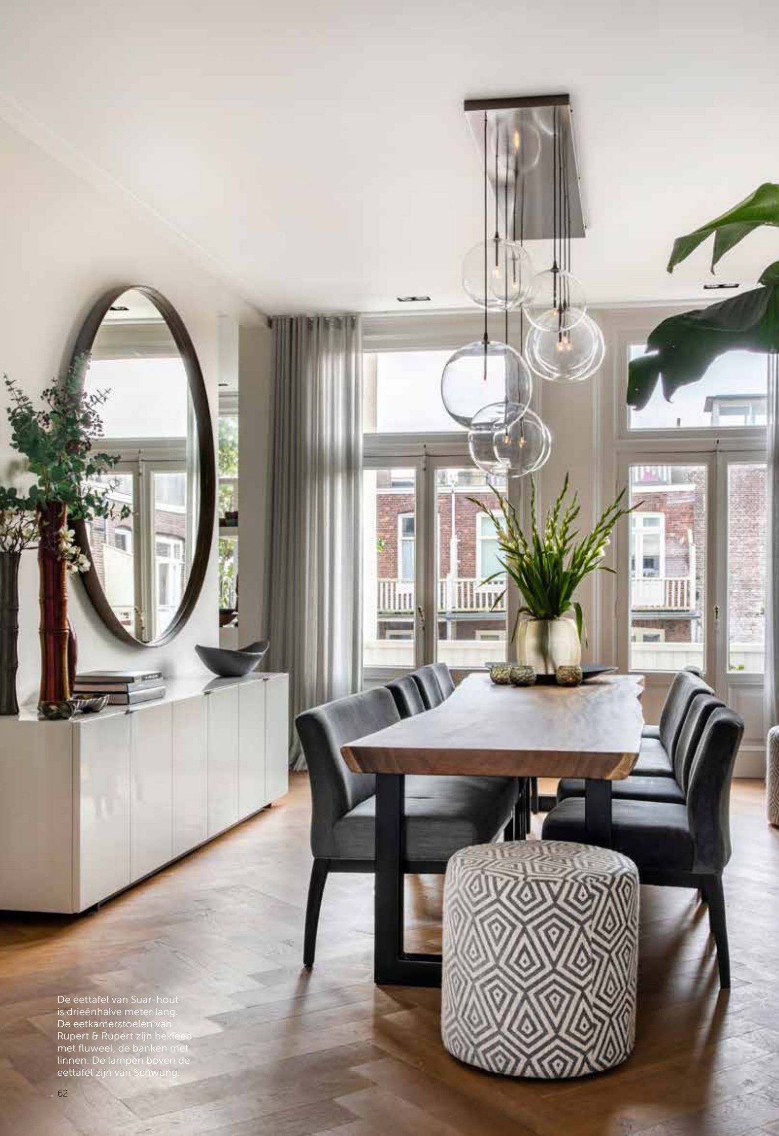
De eettafel van Suar-hout is drieënhalve meter lang. De eetkamerstoelen van Rupert & Rupert zijn bekleed met fluweel, de banken met linnen. De lampen boven de eettafel zijn van Schwung.