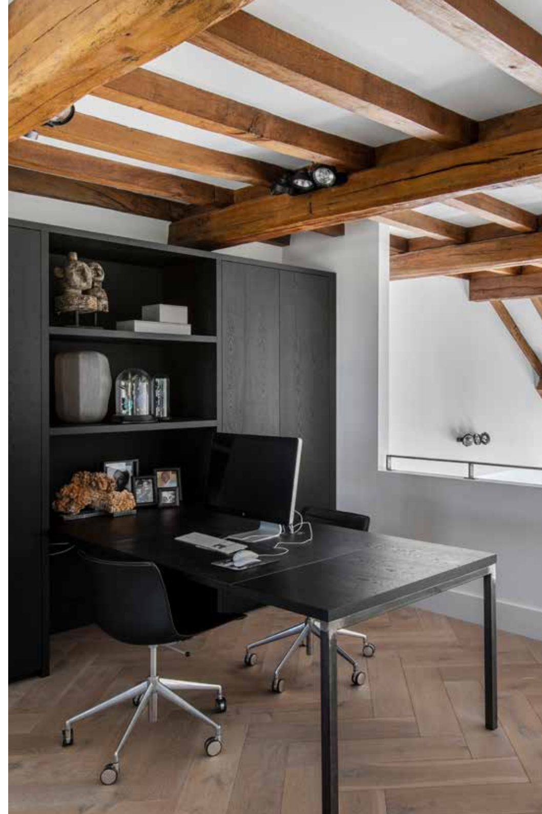
De werkkamer is in eigen beheer gerealiseerd. Het bureau is door Punt Interieurbouw gemaakt. De stoel is model Arper van Catifa.

“ALLE BINNENMUREN, PLAFONDS EN VLOEREN ZIJN GESLOOPT: IK HEB NOG NOOIT ZOVEEL PUIN BIJ ELKAAR GEZIEN”