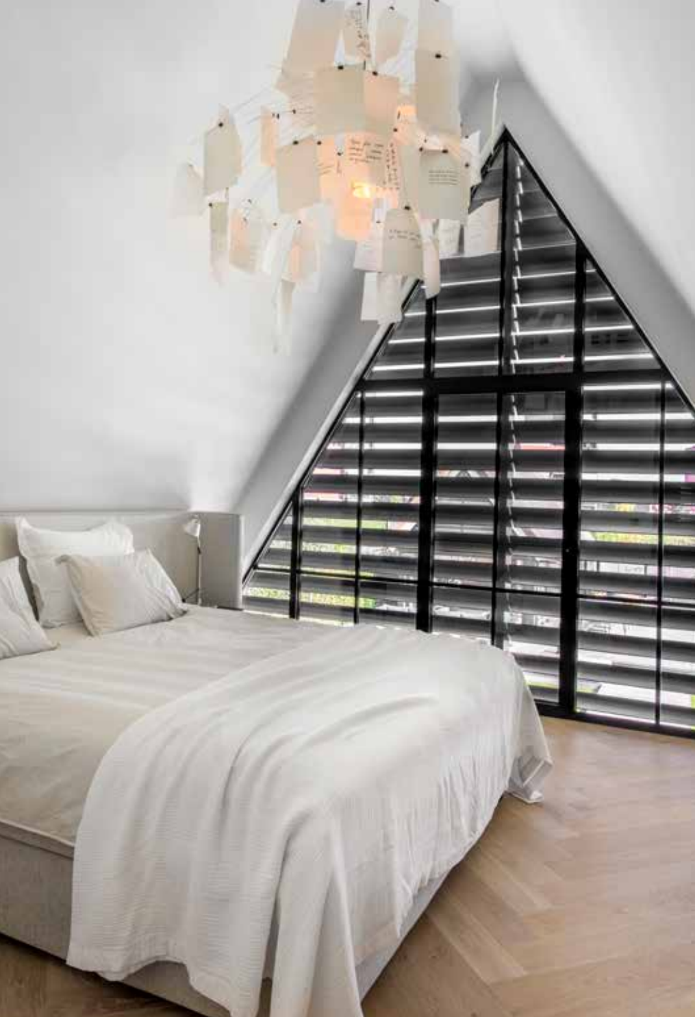
De masterbedroom met bed van Nilson Beds. De lamp is van Ingo Maurer.