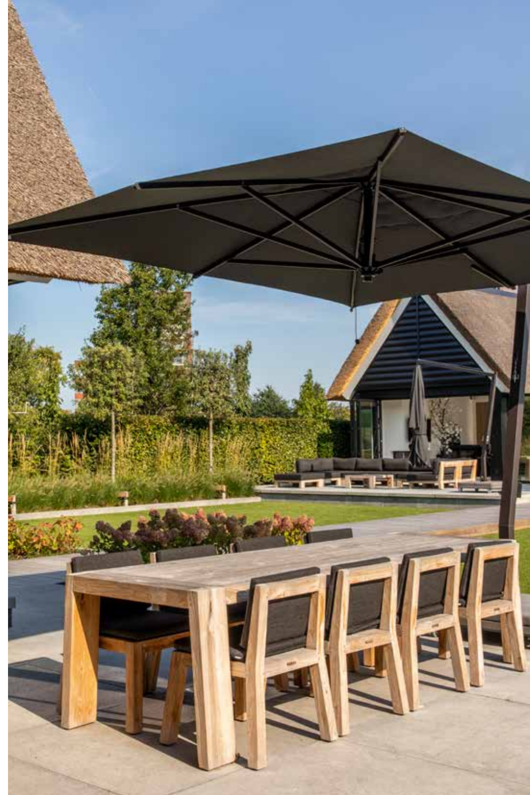
Van loungen tot tafelen, er is voor alles een aangename plek in de tuin gemaakt. Alle tuinmeubels zijn van Borek.