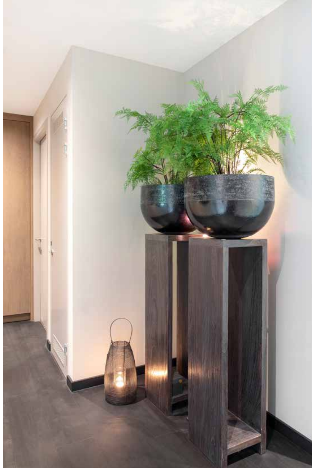
Twee grote planten op voetstuk voegen grandeur aan de entree toe.