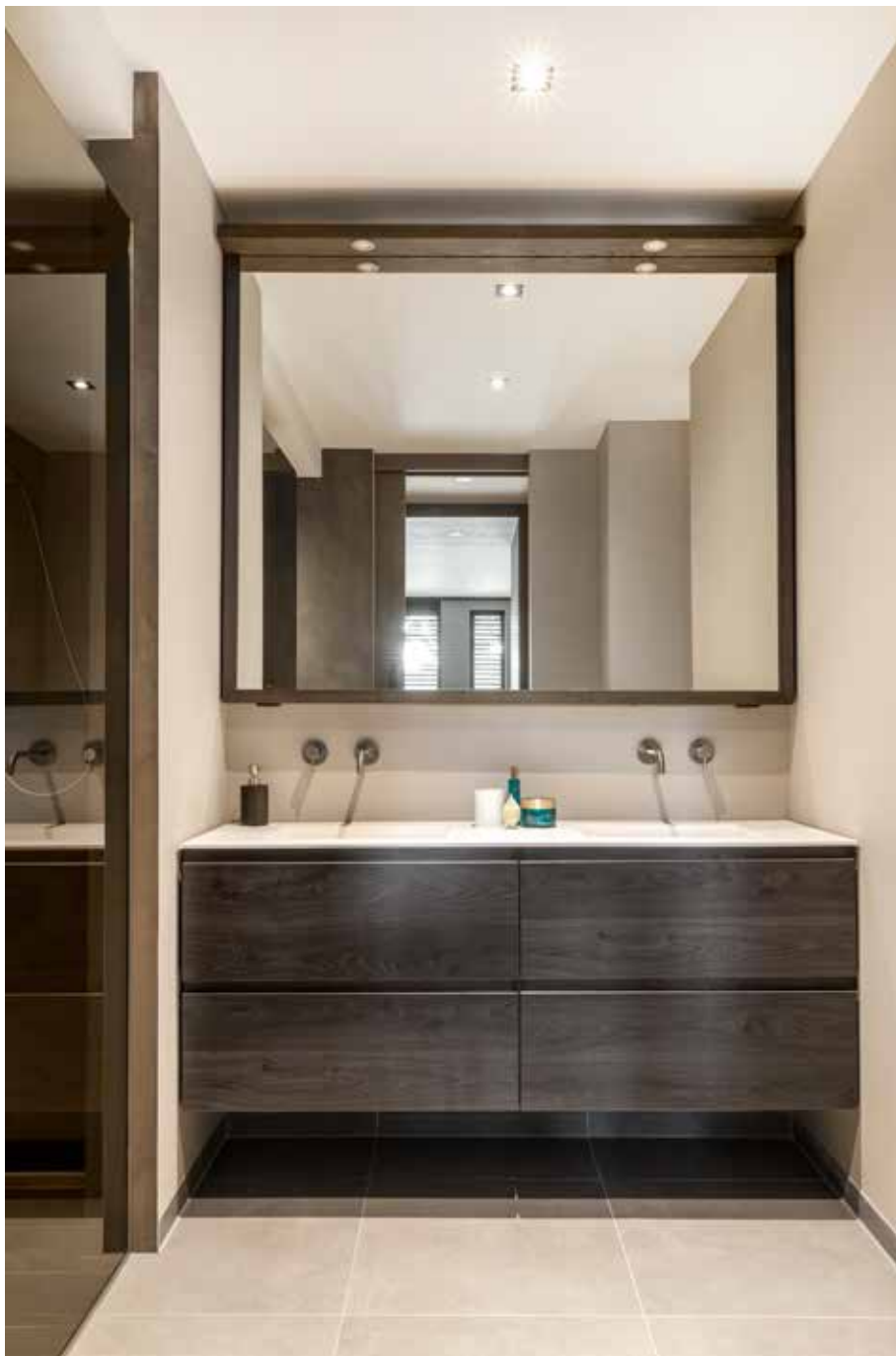
De badkamer is op maat gemaakt door Van Wanrooij Keuken, Badkamer en Tegel Warenahuys. Het badkamermeubel No Limit is van Detremmerie. De kranen komen uit de serie Laddy van HotBath.