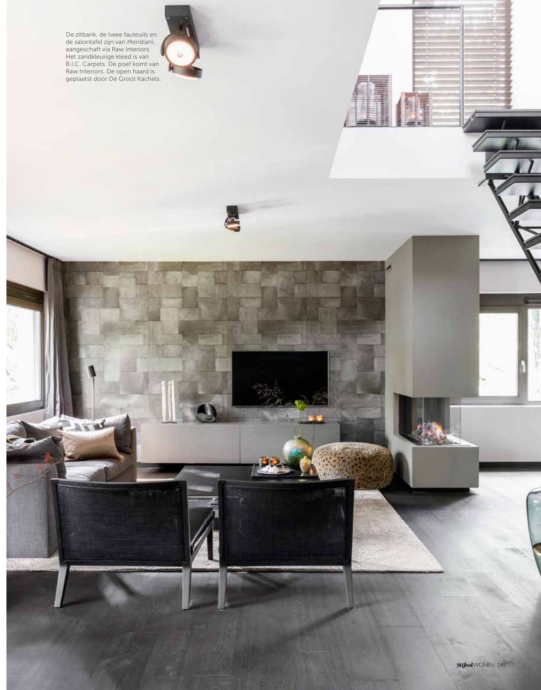
De zitbank, de twee fauteuils en de salontafel zijn van Meridiani, aangeschaft via Raw Interiors. Het zandkleurige kleed is van B.I.C. Carpets. De poef komt van Raw Interiors. De open haard is geplaatst door De Groot Kachels.

“WE ZIJN OMRINGD DOOR BOMEN, ALSOF WE MIDDEN IN DE BOSSEN WONEN”