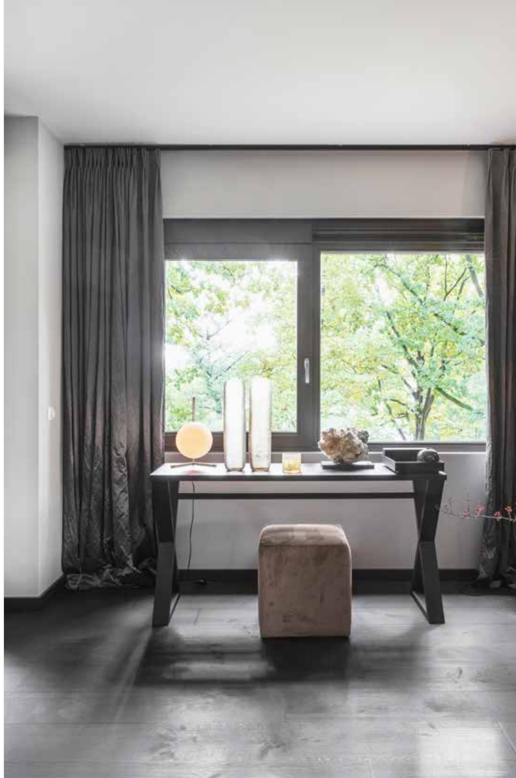
In de hoek van de woonkamer staat een sidetable met poef en vazen, alles geleverd door Raw Interiors. Op de vloer ligt geborsteld, rustiek, zwart eiken parket via Caspar Dekkers Interieurs.

“WE ZIJN OMRINGD DOOR BOMEN, ALSOF WE MIDDEN IN DE BOSSEN WONEN”